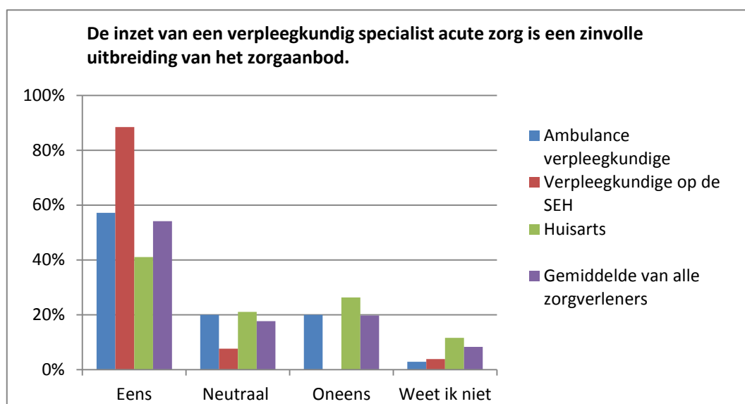
Figuur 2. Opvattingen van verschillende zorgverleners over verpleegkundig specialist acute zorg als uitbreiding van het zorgaanbod