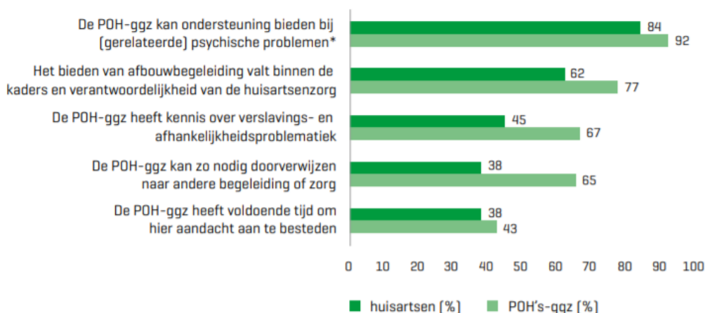
Figuur 1 Top 5 van redenen waarom POH's-ggz afbouwbegeleiding zouden kunnen bieden

Deze vraag is alleen gesteld aan respondenten die de POH-ggz geschikt of mogelijk geschikt vonden (87 huisartsen, 73 POH's-ggz). Percentages tellen niet op tot 100% omdat respondenten meerdere antwoorden konden geven.